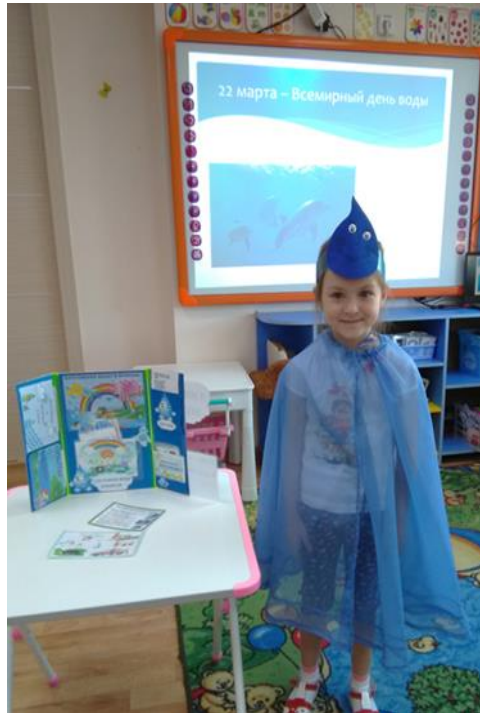
Развлечения «Путешествие капельки».