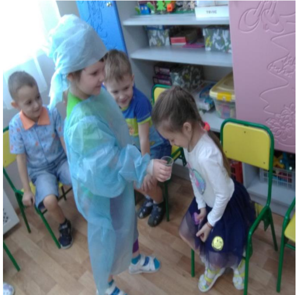
Опыты с водой.